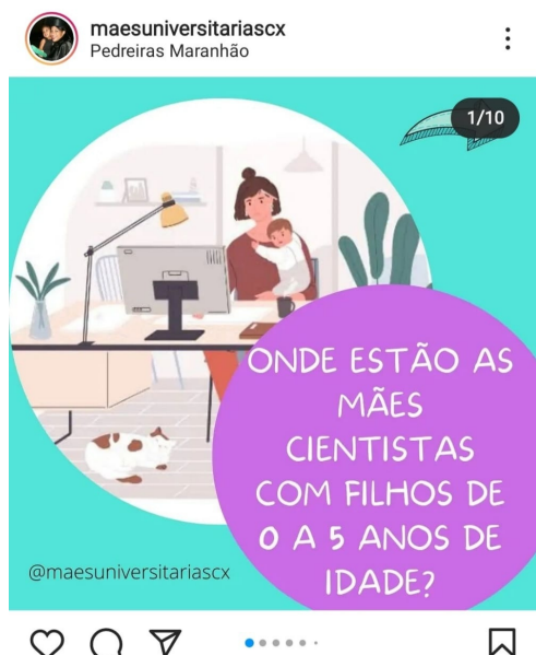
Figura 4 - Postagem 16 de outubro de 2021, do projeto Movimento Mães Universitárias

Considerando que a memória discursiva é entendida como um movimento que recupera os implícitos, os pré-construídos, os elementos citados, os relatados e os discursos transversos, ou seja, faz ver, por meio dos discursos verbais e não verbais, elementos por meio de uma regularização, observamos que em todos os posts acima, há a remissão a elementos das STEMs.