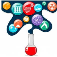
Figura 1 - Representação da Ciência

Nossa análise se inicia a partir da localização de uma regularidade icônica recorrente, que inscreve a imagem do saber nominalizado “Ciência”. Essa regularidade histórica de uma imagem que opera uma memória social funciona como uma síntese de representação imagética, tal qual se pode observar na imagem de que nos valem a seguir: