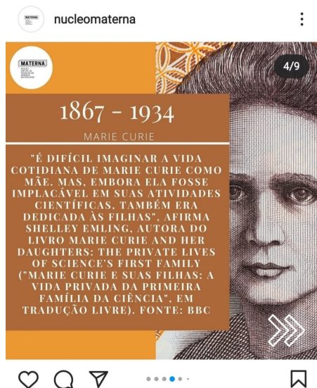
Figura 1 - Postagem 18 de abril de 2021 do Núcleo Virtual de Pesquisa em Gênero e Maternidade

Frederici (2019) afirma que o trabalho doméstico historicamente atribuído às mulheres é parte de uma engrenagem de opressão que dissemina a submissão feminina e o trabalho do cuidado não remunerado, o que provoca dissensos em relação a divisão de tarefas domésticas e vai ao encontro da descaracterização dos trabalhos que se voltam para o cuidado como de professoras da educação infantil, do ensino fundamental e do médio que, na sua maioria, estudam em cursos de humanas.