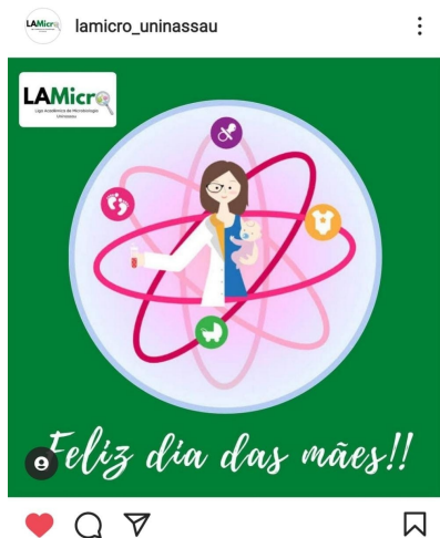
Figura 5 - Postagem do dia 9 de maio de 2021, pela Liga Acadêmica de Microbiologia da UNINASSAU

A figura 3 traz elementos imagéticos diversos, junto com os enunciados "Ciência, maternidade e pandemia - a realidade de três cientistas mães em meio a Covid-19" acompanhada de três imagens, uma delas está em vermelho, entendemos ser a representação de um vírus ou bactéria, a outra é uma mulher segurando um bebê e a terceira trata-se de uma mulher olhando em um microscópio. Logo, podemos afirmar que os implícitos são dados a ver quando colocados numa série, o que significaria dizer que ao mostrar a regularidade dos elementos que se referem a área como exatas, biológicas ou ainda as STEMs, notamos que a o sentido caminha para sedimentar o estereótipo da cientista enquanto aquela que usa jaleco ou faz uso de um microscópio.