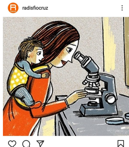
Figura 2 - Postagem 28 de janeiro de 2021 do programa RADIS de Comunicação e Saúde Fiocruz

carrossel de imagens nas postagens nas redes sociais), a que selecionamos para nossa reflexão, traz ao fundo o rosto sério da cientista e mãe Marie-Curie que não só foi a primeira ganhadora do Prêmio Nobel como conseguiu repetir o feito em razão da descoberta da radioatividade, o discurso verbal colocado a frente de seu rosto traz um quadro com a data de nascimento e morte "1867 - 1934" seguido de: "É difícil imaginar a vida cotidiana de Marie Curie como mãe. Mas, embora ela fosse implacável em suas atividades científicas, também era dedicada às filhas (...)", há, portanto, a produção de efeito de sentido pelo uso do conectivo "embora" que, numa primeira leitura, entendemos como uma mulher que era excelente no seu trabalho conseguia também cuidar das filhas, outra possibilidade interpretativa é a de que mesmo sendo cientista, ela também conseguiu cuidar das filhas. Ademais, a questão central aqui é o fato da postagem trazer Marie-Curie, mulher, mãe e cientista do campo das ciências exatas. Diante do que nos trouxeram os algoritmos, essa postagem, tal como outras, traz a imagem de uma cientista de importância singular para os estudos sobre radioatividade, há um suposto apagamento da imagem das cientistas em outras áreas como aquelas que também teriam grandes feitos.