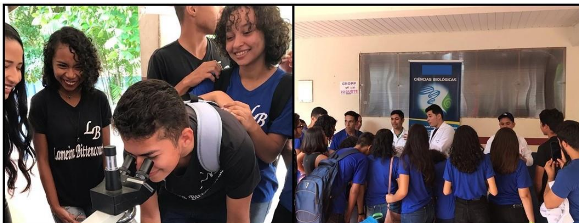
Figura 2. Estande de biologia.