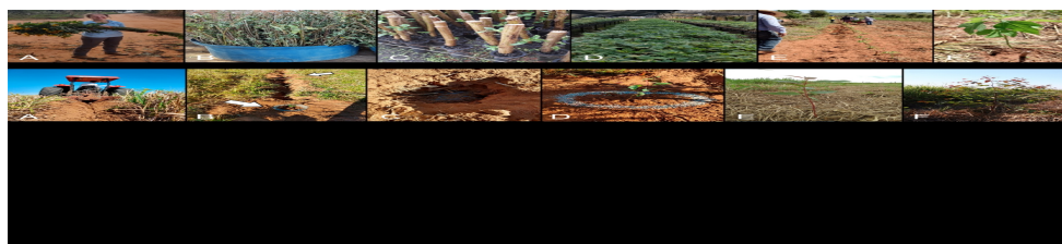
Figura 1. Etapas do plantio das mudas de E. urograndis para implantação de Sistema Silvipastoril intensivo na Fazenda Itapuã. A – Trator fazendo os sulcos nas linhas pré-demarcadas. B – Imagem demonstrando o nivelando do sulco nos locais de plantio das mudas. C – Aplicação de 500 ml de hidro gel nas covas feitas utilizando cavadeira. D – Adubação de cobertura no plantio, utilizando 220 g da formulação 4-30-10. E – Imagem demonstrando as linhas dessecadas após aplicação de herbicida. F – Muda estabelecida e com bom desenvolvimento cerca de 5 meses após o plantio (abril/2020).

A implantação das árvores começou em agosto de 2019, seguindo as diretrizes de GUERREIRO et al. (2013). A área foi preparada previamente para o plantio, incluindo o controle de formigas cortadeiras, demarcação e sulcamento das linhas com equipamento adequado (Fig. 1, A). As mudas foram plantadas manualmente em berços nivelados e com hidrogel já aplicado, seguido de adubação de cobertura e distribuição de iscas formicidas ao longo das linhas (Fig. 1, B, C, D, E). O controle da braquiária foi feito com herbicida (glifosato) (Fig. 1, E, F). Houve replantios em dezembro de 2019 e janeiro de 2021, além de substituições pontuais de plantas perdidas.