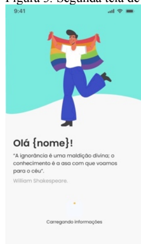
Figura 3. Segunda tela de acesso.