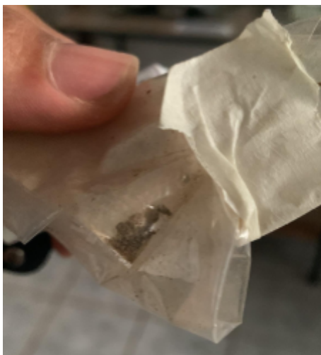
Figura 3. Produto final em pó com formação de aglomerados.

secas em suspensão, ou quando entram em contato como o leito de partículas já aquecidas [1].